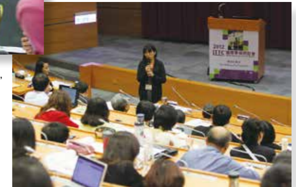
2012 LTTTC 國際學術研討會