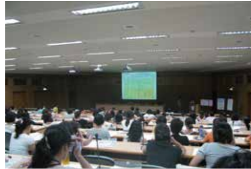
GEPT 英語教師研習活動