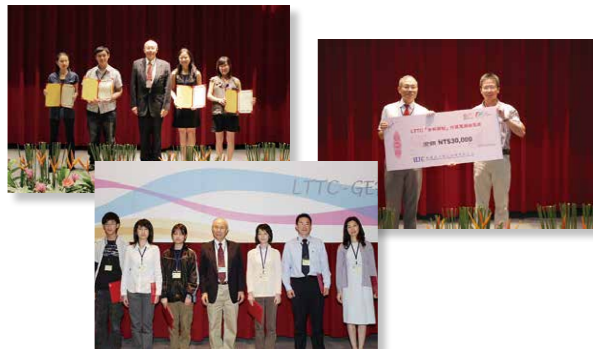
獲獎考生與頒獎人合影

LTTC 不定期提供獎項鼓勵在學青年或社會人士結合英語學習與文化交流，拓展國際視野。